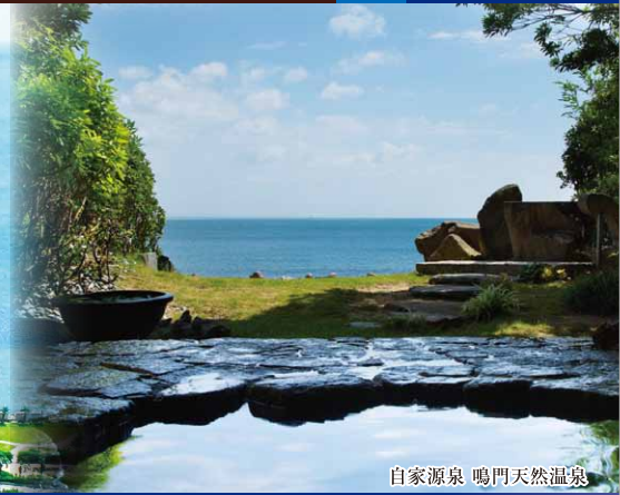
自家源泉 鳴門天然温泉