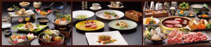
◆和会席「鳴門」 ◆フレンチ会席「フォーシーズン」 ◆炭火焼「海風」 *月火定休(例外あり)