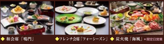
◆和会席「鳴門」 ◆フレンチ会席「フォーシーズン」 ◆炭火焼「海風」*限定日営業